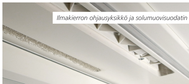
Ilmakierron ohjausyksikkö ja solumuovisuodatin